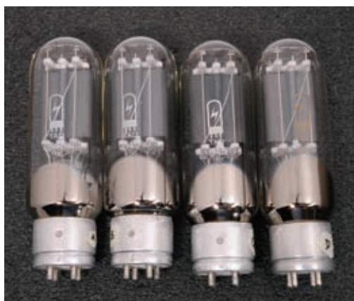
△ Viva Audio 的 Aurora 單聲道功率放大器所用真空管，無論是 845 和 211 均來自德國 TAD(Tube Amp Doctor)。